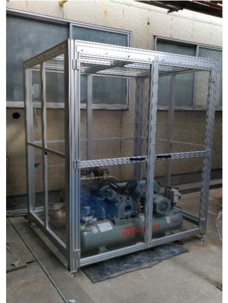
屋外コンプレッサカバー：防塵・雨・防音対策