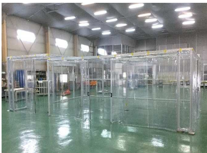
ソフトウォールタイプ (制電PVCシート仕様)