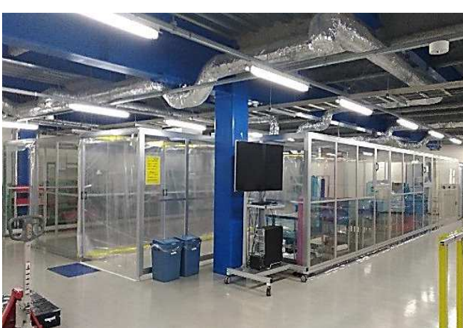
ハードウォールタイプ (出入口はカーテン仕様)