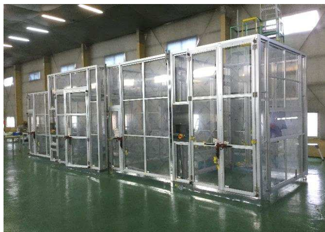
ハードウォールタイプ (制電PVC)