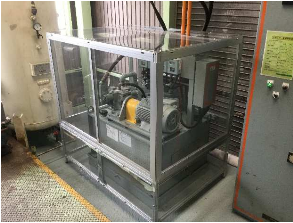
脱水機カバー：防塵対策