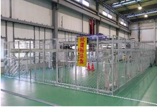
自動コンベア設備への侵入防止

工場などの設備の防護や機械区域への侵入防止。作業者への安全を確保する為の間仕切り。 アルミフレームのカラーは、安全用のイエロー色での製作も可能です。