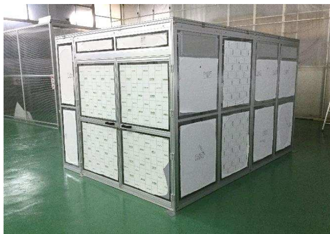
ハードウォールタイプ